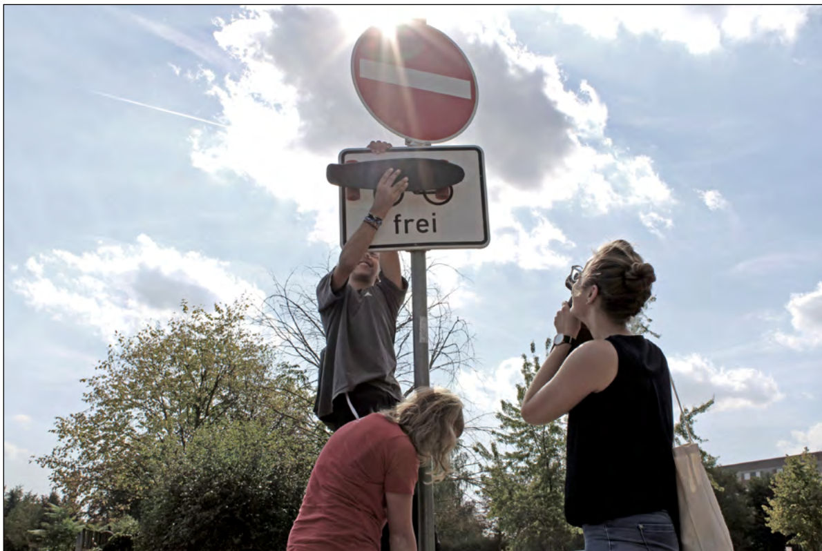
Fotografie «Zwischen frei sein und unerwünscht» aus einem Workshop im Rahmen des Projekts «LiVe – Lebenswelten in Verbindung»

ten Fall selbst und eigenverantwortlich für ihre Belange einsetzen können.