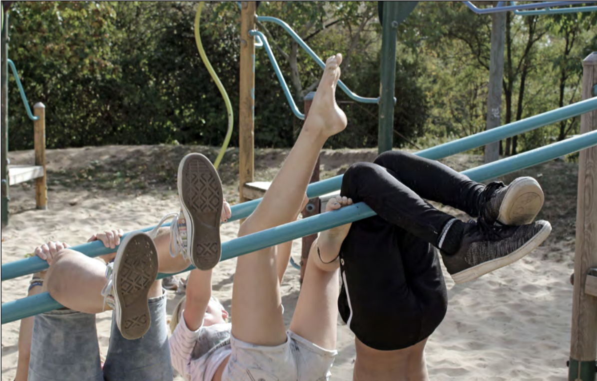
Fotografie «Alles steht Kopf» aus einem Workshop im Rahmen des Projekts «LiVe – Lebenwelten in Verbindung»