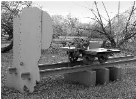
Das Denkmal »Von der dicken Berta zur roten Rosa« des israelischen Bildhauers Igael Tumarkin steht auf dem Mittelstreifen der Bundesallee an der Einmündung Spichernstraße – einem Ort, der am Verschleppungsweg zum Hotel Eden lag. Der Kopf der Luxemburg – im Stahlrelief dargestellt – bändigt das unheilvolle Gefährt des als »Dicke Berta« bekannten Feldgeschützes.

Bronzeplastik von Rolf Biebl und Keramikreliefs von Ingeborg Hunzinger vor dem Eingang des Hauses Franz-Mehring-Platz 1 im Bezirk Friedrichs- hain – ein Gebäude, in dem auch die Rosa- Luxemburg-Stiftung ihren Sitz hat. Die Reliefs schaffen einen Bezug zu Karl Liebknecht und zu Rosa Luxemburgs langjähriger Sekretärin