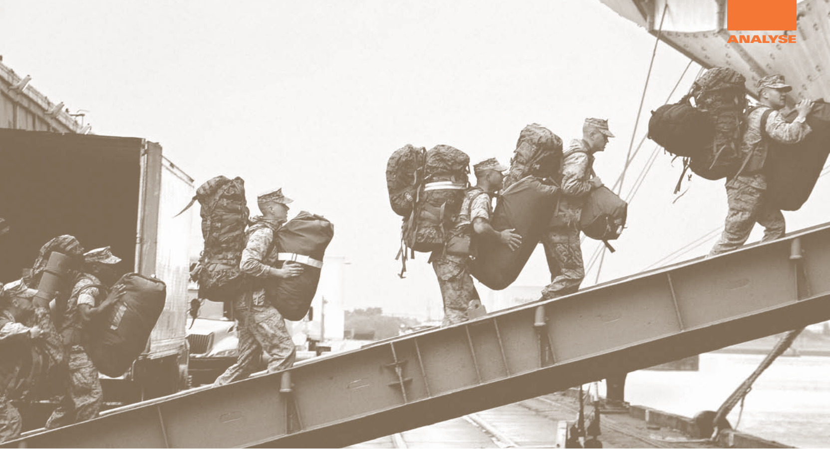
US-Marines besteigen im März 2011 ein Kriegsschiff im Hafen von Morehead City, North Carolina/USA. Ihr Ziel: Das Mittelmeer.