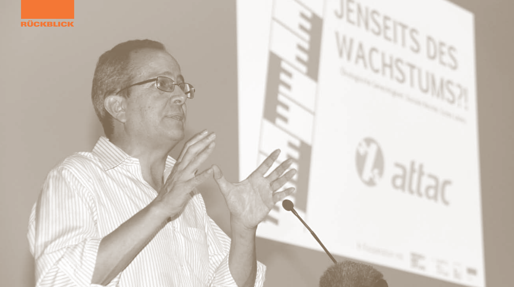
Der ecuadorianische Wirtschaftswissenschaftler Alberto Acosta sprach auf dem Kongress «Jenseits des Wachstums» im Mai 2011 in Berlin