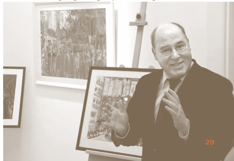
Stiftungsmitglied Gregor Gysi bei der Übergabe der Bilder in Berlin

HENNING HEINE IST PRESSESPRECHER DER ROSA-LUXEMBURG-STIFTUNG