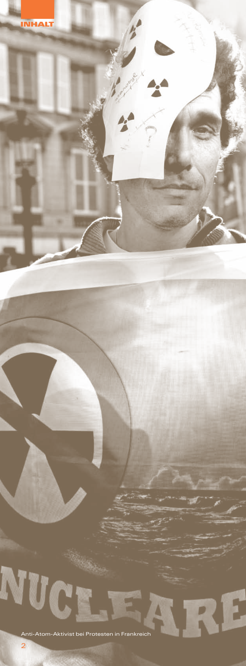
Anti-Atom-Aktivist bei Protesten in Frankreich