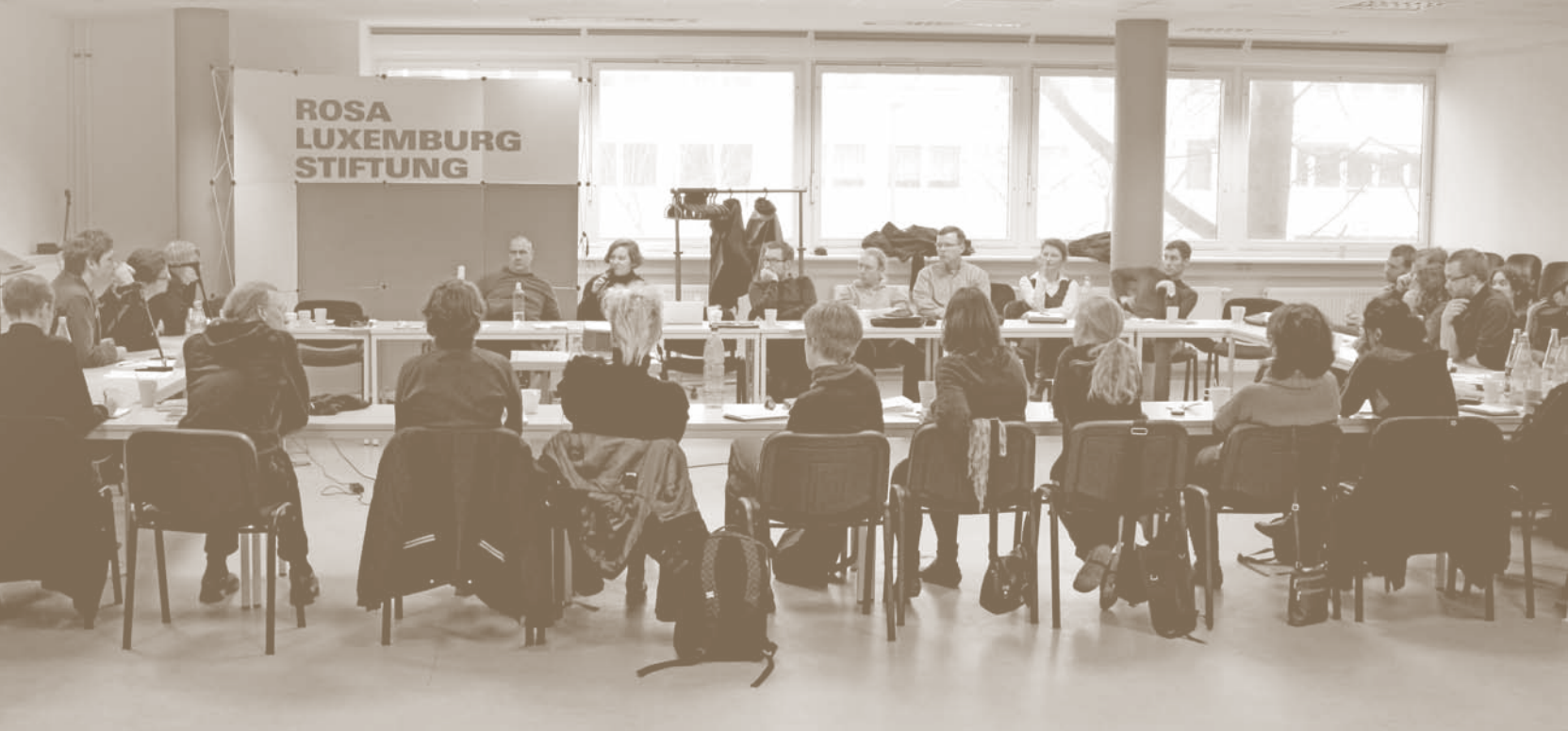
Junge WissenschaftlerInnen tauschten sich in Berlin über Hochschullaufbahnen und außeruniversitäre Berufsfelder aus.