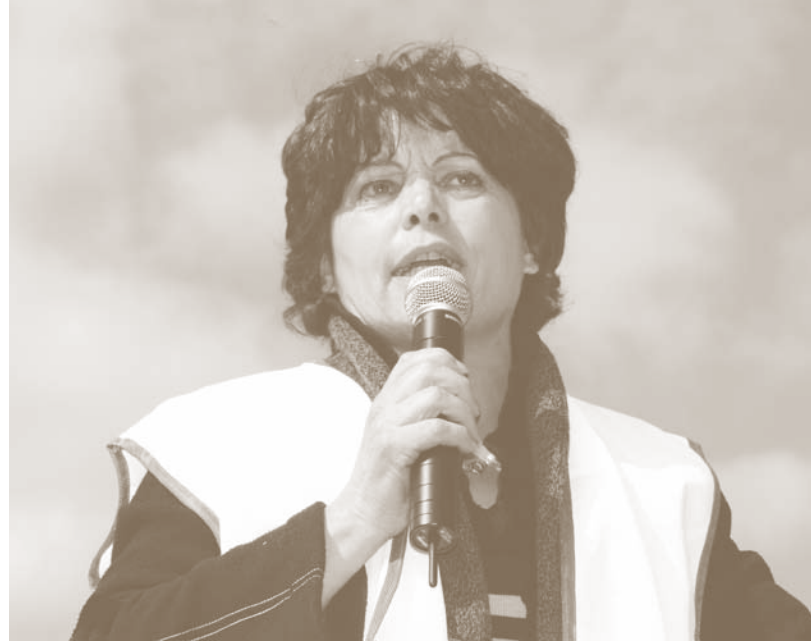
Europaabgeordnete und Aktivistin Michèle Rivasi

Rivasi: Problematisch ist doch, wer über die Schließung von Kernkraftwerken entscheiden wird, die nicht den Normen entsprechen. Meine Kritik an der Position Frankreichs bezieht sich darauf, dass die Verantwortlichen nicht wollen, dass externe Sachverständige die Kontrolle der Reaktoren vornehmen. Wenn es aber die gleichen Ingenieure sind, die gegenwärtig die nationale Sicherheitskontrollen ausführen; wenn also diese Ingenieure die Kontrollen vornehmen, die schon immer die französischen Kernkraftwerke kontrolliert haben, so werden sie wohl kaum ihre Ergebnisse von früher in Frage stellen und sagen: Wir stehen nicht mehr hinter dem, was wir vorher festgestellt haben. Dann ist da auch noch der Präsident der Republik, Sarkozy, der sagt: Weil unsere Kernkraftwerke so teuer sind, sind sie auch sicher. Das ist absolut falsch. Die neuen Kraftwerke haben niemals gut funktioniert. Der erste Reaktor der neuen Generation, der in Finnland gebaut wurde, wurde noch immer nicht ans Netz genommen. Man kann also