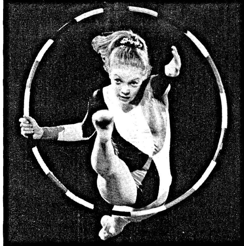
Oksana Skaldina (UdSSR) zelebriert die Schönheit der Rhythmischen Sportgymnastik bei ihrer Reifeprüfung und gewann den Vierkampf beim Masterturnier in Stuttgart. Wird es ähnlich dynamische „Bonbons“ bei den DDR-Meisterschaften am Wochenende in Halle-Neustadt zu bewundern geben?