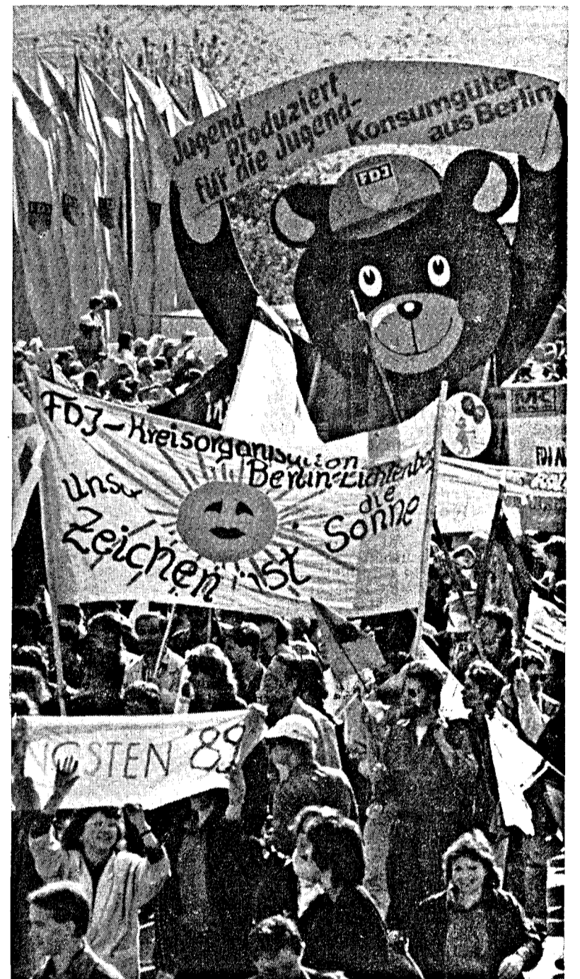
Mittendrin das Wappentier der Hauptstadt