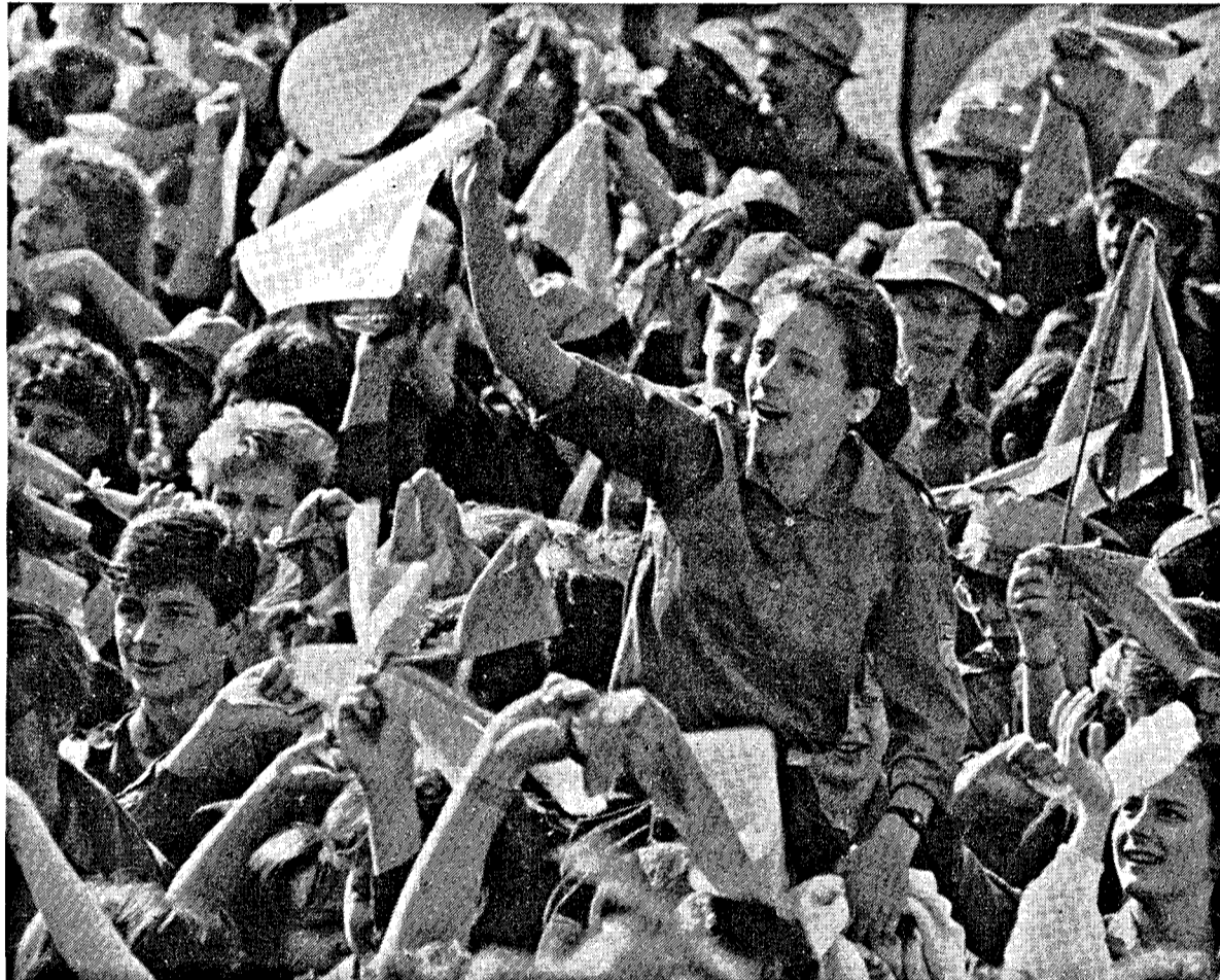
Herzliche Grüße an die Partei- und Staatsführung