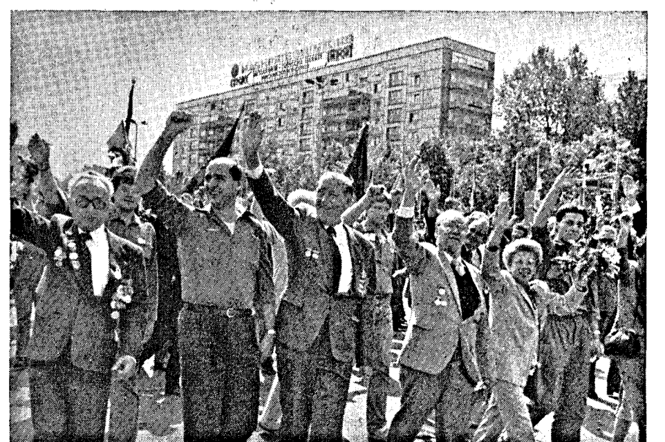
FDJler und Veteranen der bewaffneten Kräfte Seite an Seite