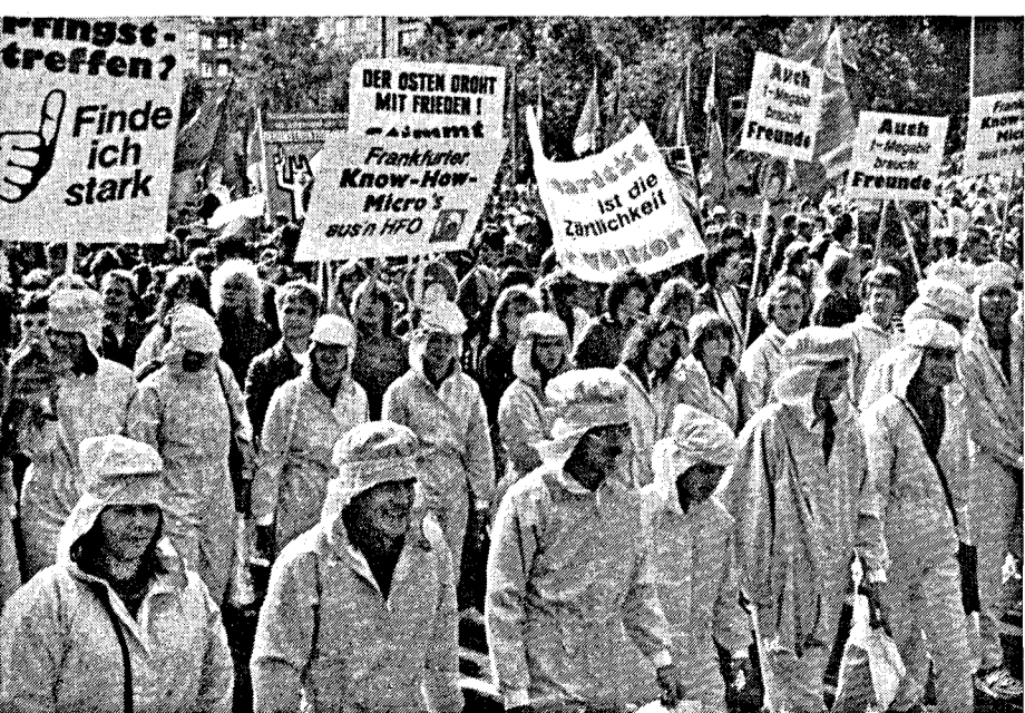
Junge Mikroelektroniker aus dem Halbleiterwerk Frankfurt (Oder)