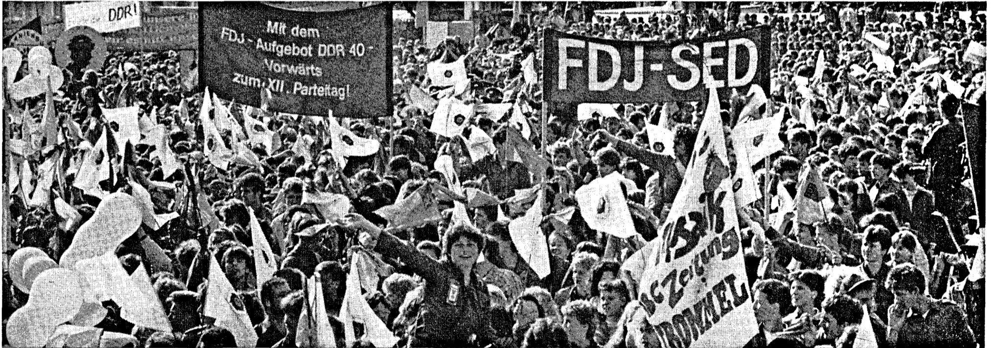
Immer kam zum Ausdruck: FDJ und SED gehören fest zusammen