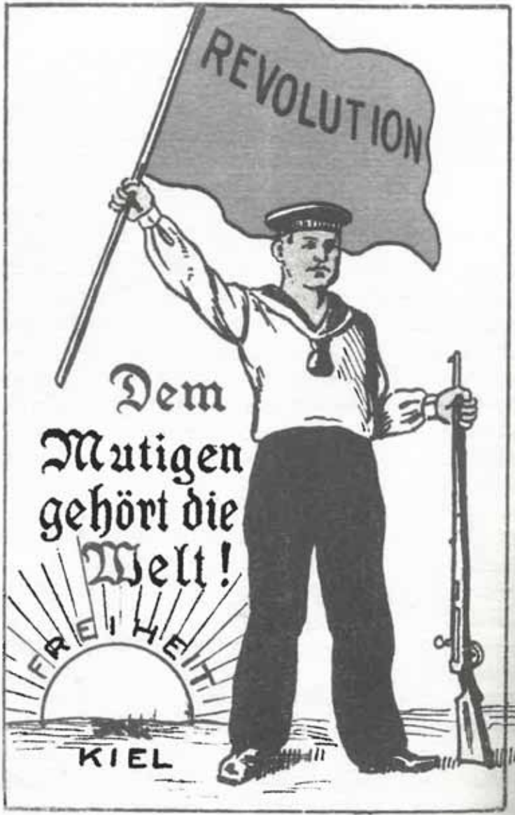
Postkarte unbekannten Ursprungs.

Die erste Soldatenratssitzung in ganz Deutschland tagte im Speisesaal am Montag, den 4 November.