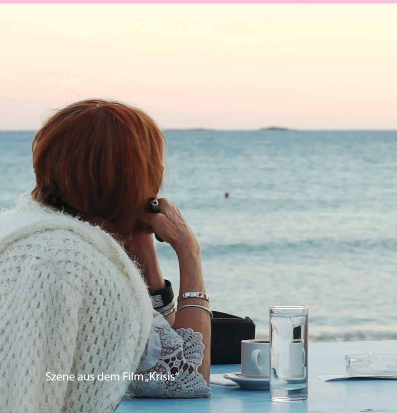
Szene aus dem Film „Krisis“