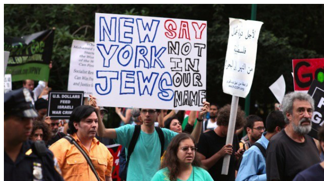
Foto: Gaza Solidarity March New York City 2014 @Martyna Starosta/Forward

Die alte jüdisch-amerikanische Zeitung ‚Forward‘, in ihrer Englischversion ursprünglich sozialistisch, heute linksliberal ausgerichtet, berichtet ausführlich vom Protest New Yorker Juden und jüdisch-ameri-