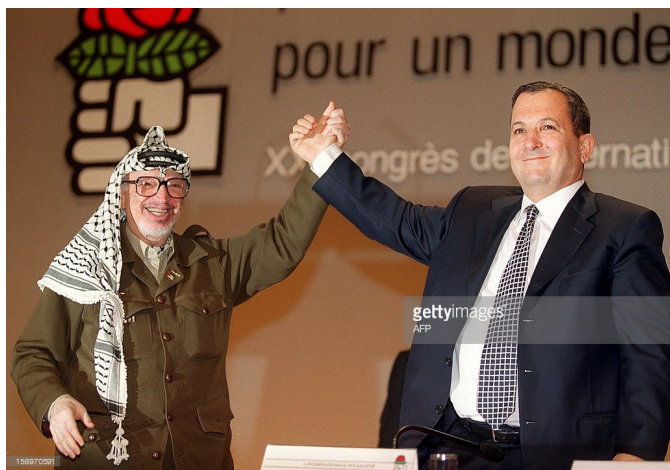
Foto: Premierminister Ehud Barak und Palästinenser Präsident Yasser Arafat bei einem Treffen 1999 in Paris

Zwar sei die gesamte Linke trotz der Kriege konsequent für ein Friedensabkommen mit den PalästinenserInnen, für die Zwei-Staaten-Lösung, und gegen die Siedlungen. Trotzdem gibt es Konflikte. Wahlstrategisch bedienen die Parteien verschiedene Klientel: „Die Arbeitspartei versucht Stimmen aus der Mitte der Gesellschaft zu erzielen, während Meretz eine sehr elitäre, nicht-religiöse Klientel anspricht. Auch die Aktivitäten der NGOs sind von diesen Auseinandersetzungen beeinflusst, da man sich für ein Lager entscheiden muss. Eine weitere Kluft die nur schwer zu überwinden ist, stellt die Spaltung in zionistische und nicht-zionistische Gruppen dar“ (Ibid, S. 2). Außerdem spielt die Außenpolitik gerade in Israel eine große Rolle: „die Mehrheit der israelischen Linken sind nicht so pazifistisch, wie sie es in einer friedlichen Situation sein können, in der die Armee nur die Sicherheit des Landes garantiert und nicht Kriege führt“ (Ibid, S. 3).