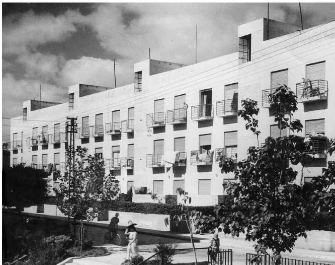
Foto: Arbeiterwohnsiedlung 1936 in Tel Aviv. Architekt Arie Shon

Eine weniger bekannte Affinität zwischen den Zielen der Arbeiterbewegung und zeitgenössischer Kultur – sowohl in der Weimarer Republik als auch beim Aufbau Israels – betraf die Architektur. Speziell die Bauhaus-Architektur, die für eine anti-bourgeoise und anti-individualistische Attitüde stand. Bauhaus, das war Inkarnation der Moderne, welche demokratische politische Systeme als Vorbedingung, als Luft zum Atmen, brauchte. Mit dem Ende der Weimarer Republik wanderten Bauhaus-Ideen nach Palästina aus. Mit bis zu 4000 Gebäuden in Tel Aviv, die dem unmittelbaren Einfluss des Bauhauses zugeschrieben werden, handelt es sich um die weltweit größte Konzentration – manche sprechen vom ‚Weltzentrum‘ - dieses bis heute einflussreichen Baustils. „Nachweislich sind 19 Schüler des Bauhauses ab 1933 in Palästina angekommen. Ihnen gelang in der frühen Zeit des Nationalsozialismus noch die Flucht aus Berlin. Unter ihnen arbeiteten vier Meisterschüler, darunter Munio Gitai (Weinraub), Edgar Hed (Hecht), Shmuel Misteckin und besonders Arie Shon, die vor allem in Tel Aviv wirkten.