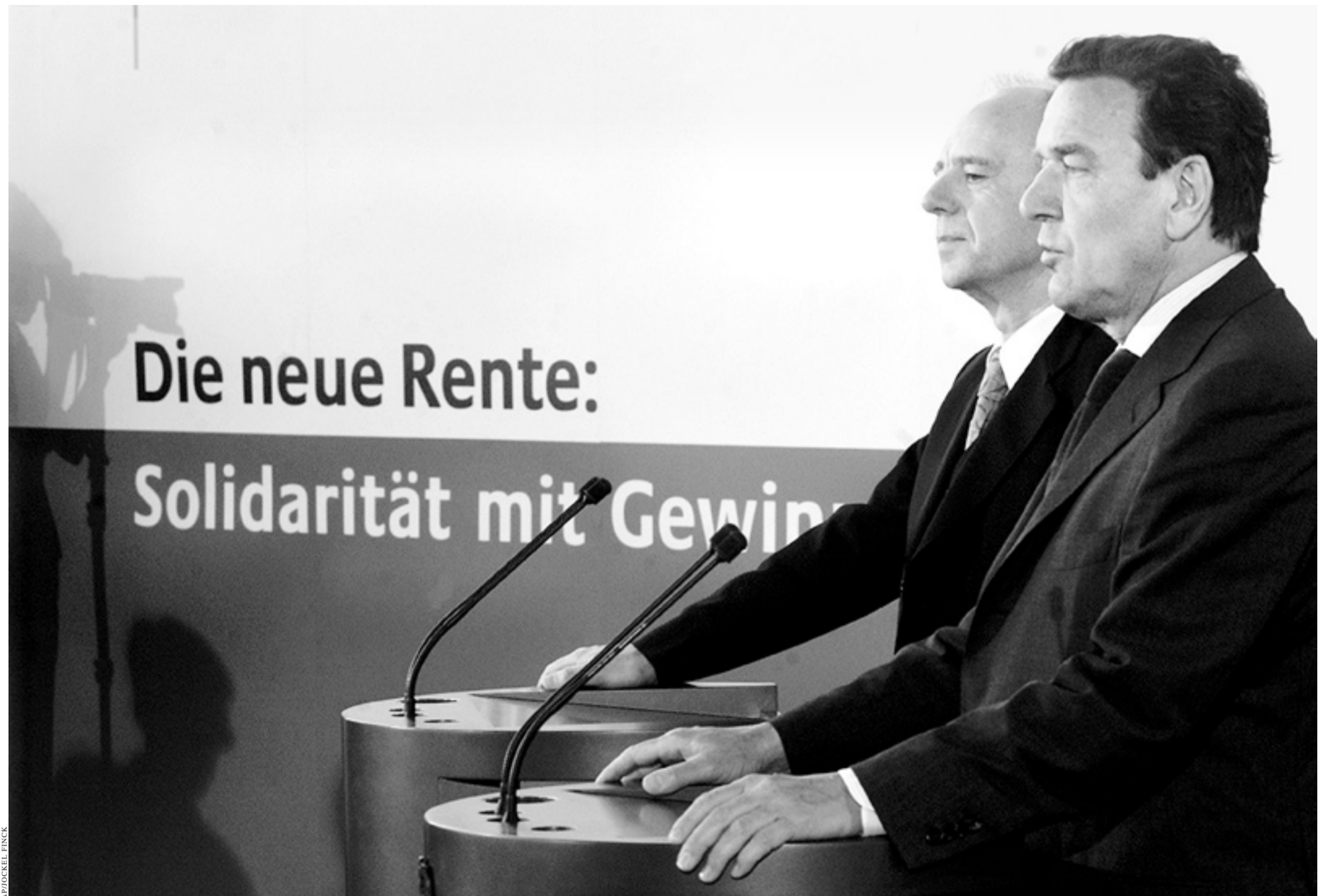
Solidarität mit Gewinn: Mit der »Riester-Rente« bewies die Regierung von Gerhard Schröder ihre Sympathie für die Finanzdienstleister und deren Profitstreben (mit Walter Riester (SPD), Berlin, 11.5.2001)