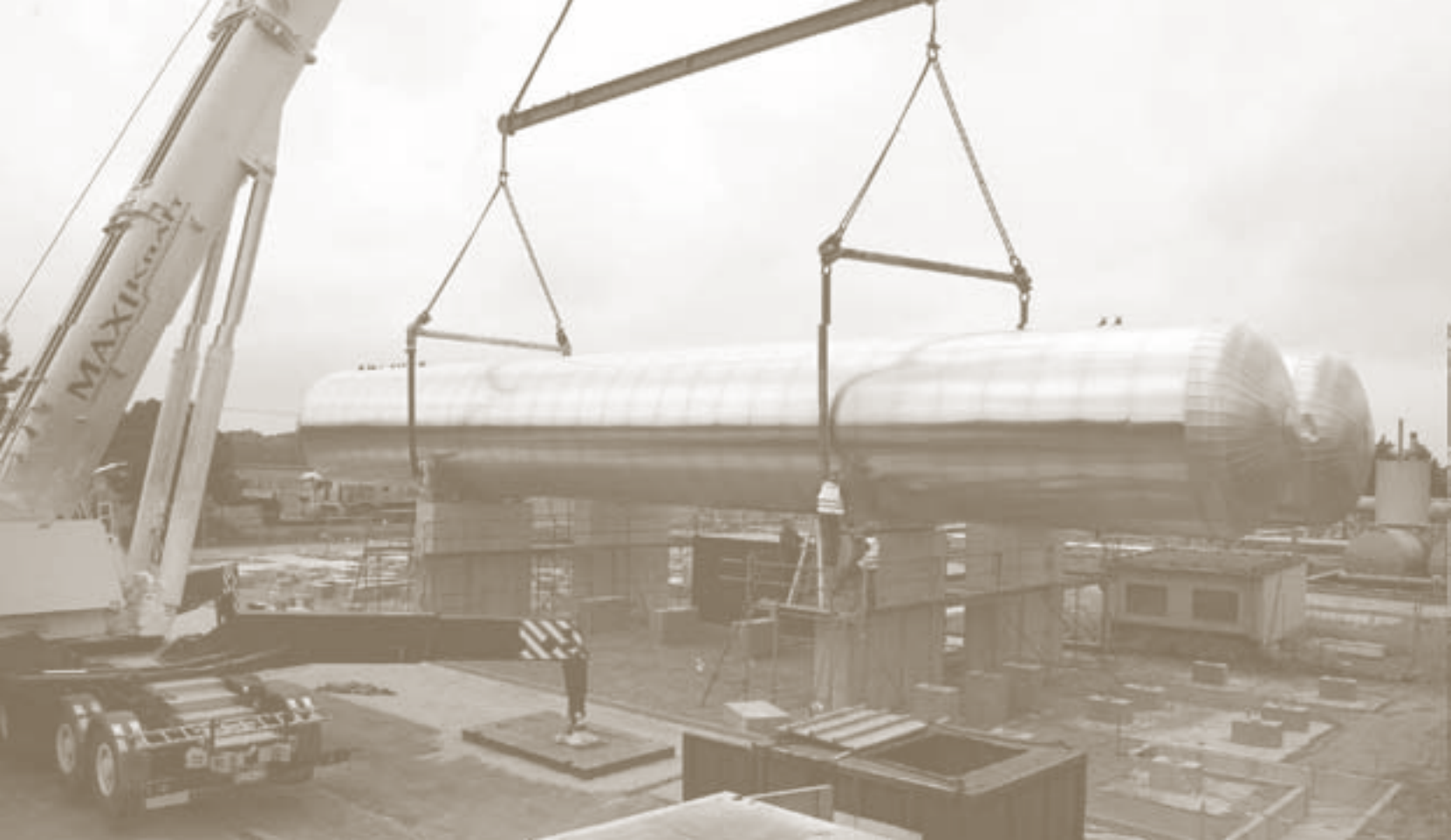
Montage von Kohlendioxidtanks auf einer Versuchsanlage in der Altmark/Sachsen-Anhalt.