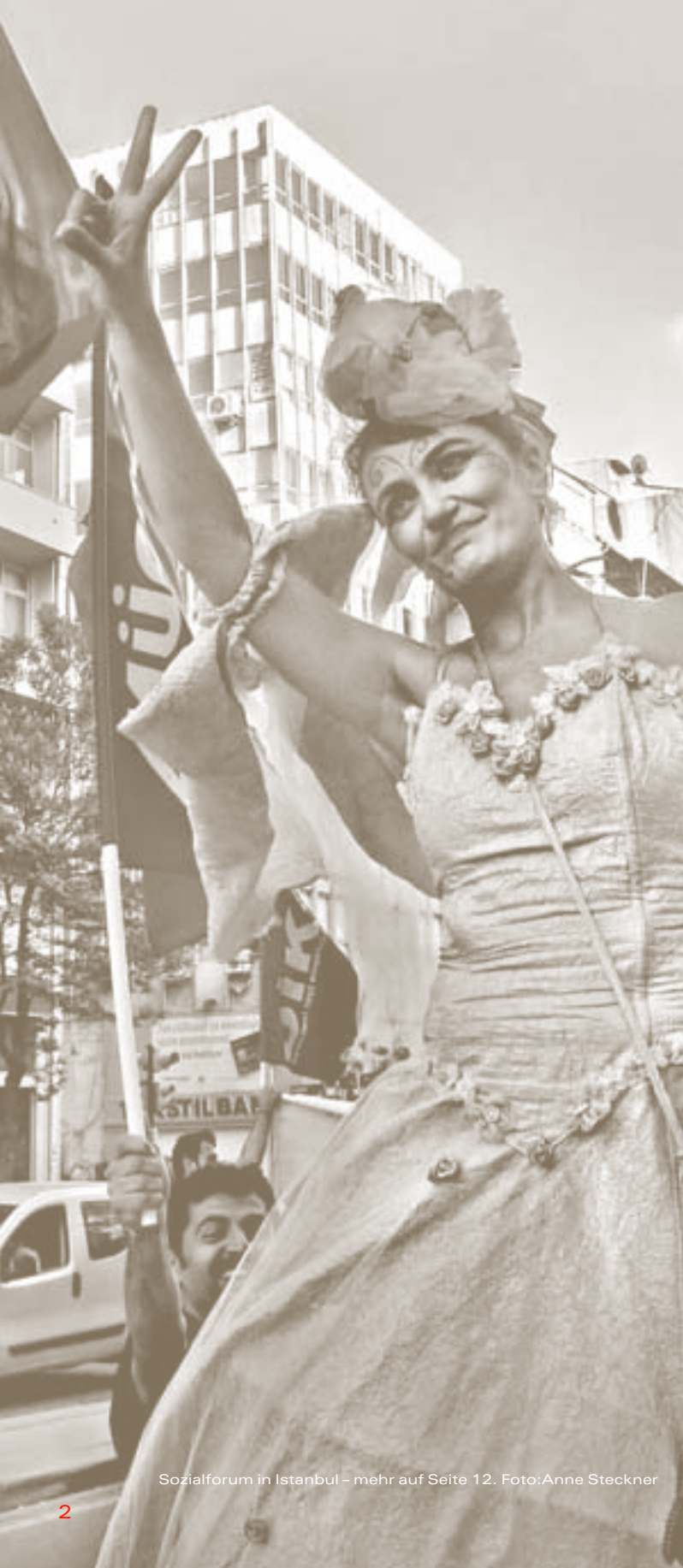
Sozialforum in Istanbul – mehr auf Seite 12.