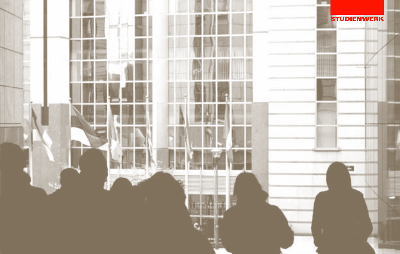
StiftungsstipendiatInnen vor dem EU-Parlament in Brüssel.