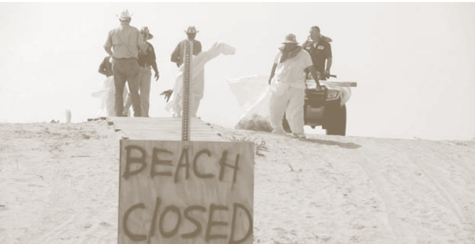
«Strand geschlossen»: Reinigungsarbeiten in den Dünen von Grand Isle im US-Bundesstaat Louisiana im Mai 2010.