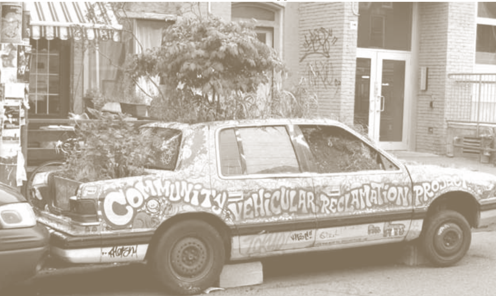
Pflanzen auf Rädern: Protestaktion gegen den Autoverkehr im kanadischen Ontario.

EINE LANGFASSUNG des Artikels ist als Standpunkt 14/2010 der Rosa-Luxemburg-Stiftung erschienen und findet sich online unter www.rosalux.de/publikationen.html . Beiträge zu «Buen Vivir», Klimagerechtigkeit und «Reproduktionsökonomie» sind auch in den Ausgaben 1/2009 sowie 2/2010 der Zeitschrift «Luxemburg» erschienen.