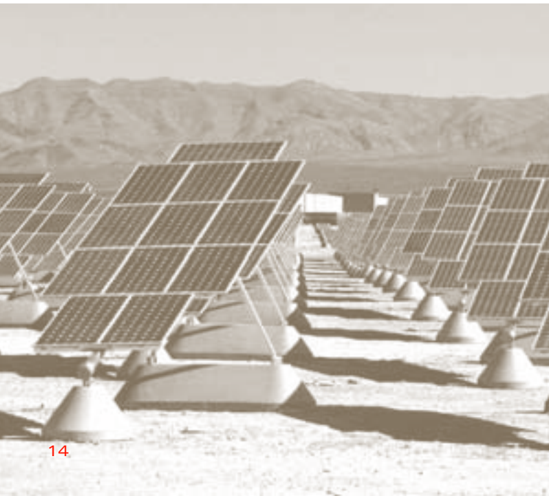
Solarfeld auf einer US-Luftwaffenbasis.

Zweiten Weltkrieg erweitert. Dem steigenden Angebot von Waren, das dem Produktivitätszuwachs geschuldet ist, muss die Nachfrageentwicklung entsprechen. Doch nun bekommt diese Entsprechung eine besondere Note. Die fordistische Massenproduktion verlangt die Förderung der Massennachfrage. Dies ist aber nicht Wirkung eines systemimmanenten Automatismus, sondern Ergebnis von gewerkschaftlichen Lohnkämpfen und von sozialen Auseinandersetzungen um den Sozialstaat. Massenproduktion und Massenkonsumtion bringen spezifische soziale und kulturelle Praktiken hervor, und sie haben einen ebenfalls massenhaften Naturverbrauch zur Folge. Die Naturzerstörungen, die erkennbaren Grenzen der Verfügbarkeit von Rohstoffen und der Tragfähigkeit der Ökosysteme für alle möglichen Schadstoffe ließen nun auch ökologische Grenzen des Wachstums erkennen, die vom «Club of Rome» seit Anfang der 1970er-Jahre mit großer medialer Aufmerksamkeit thematisiert worden sind. Doch diese existierten immer schon.