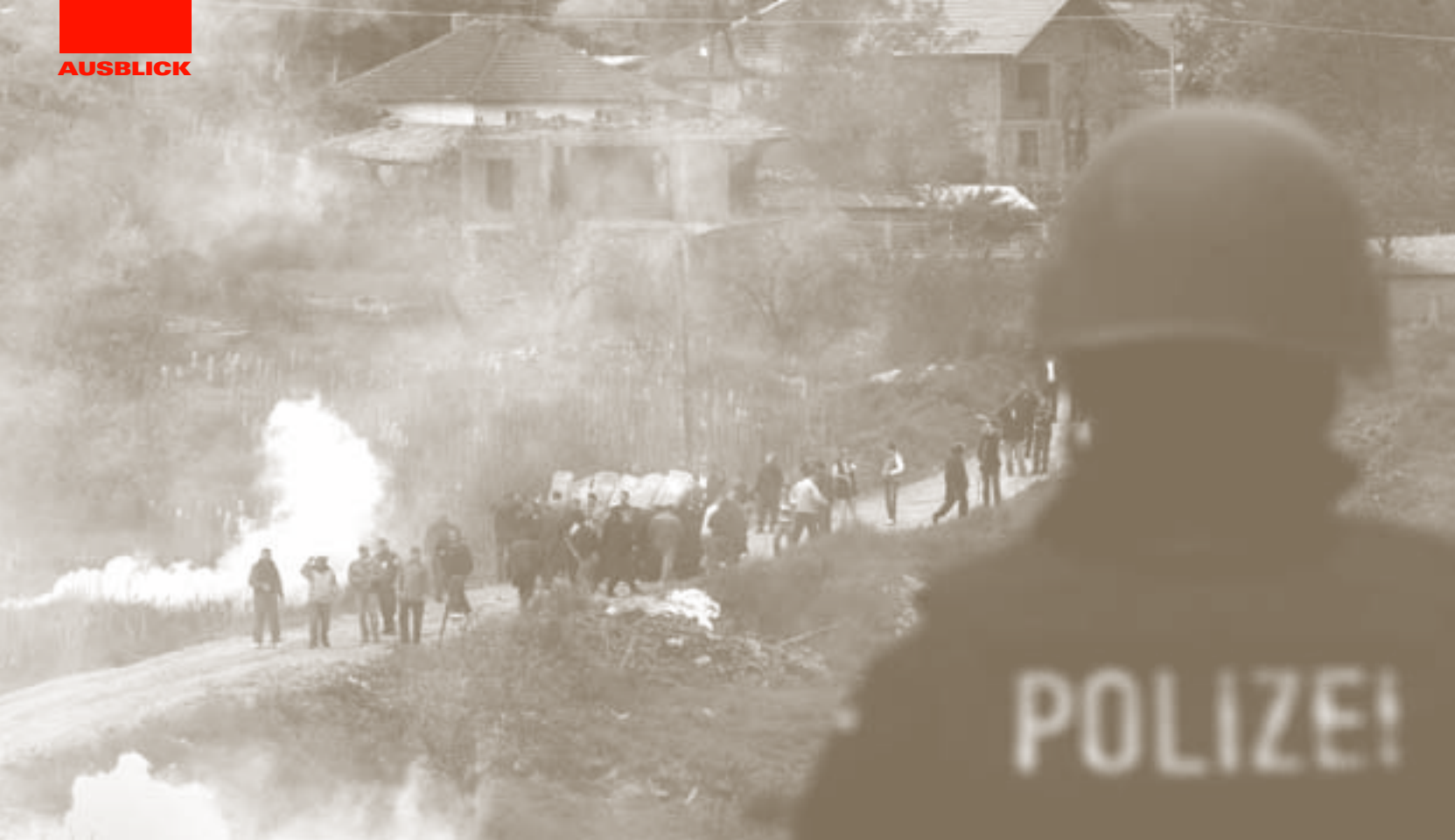
Ein deutscher Polizist im Mai 2009 im kosovarischen Mitrovica. NATO und EU-Polizeikräfte gingen dort gegen serbische Demonstranten vor.