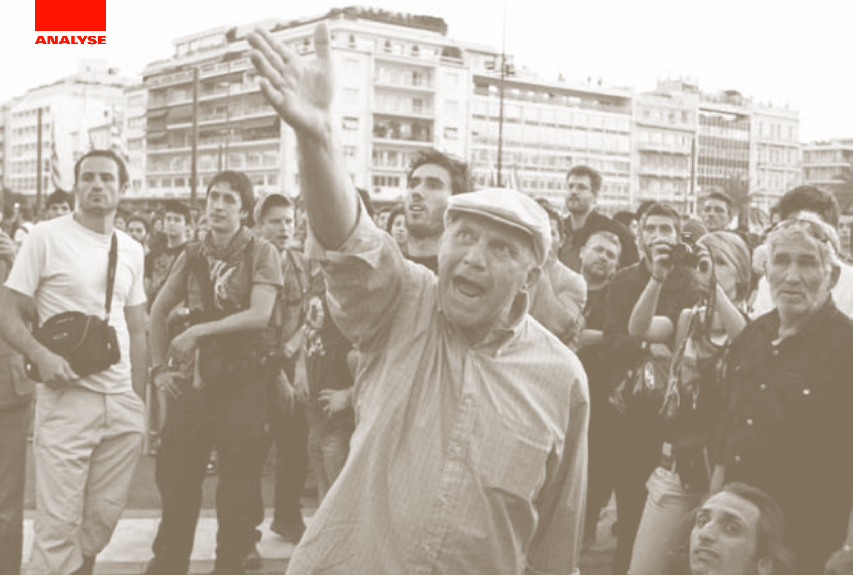
Empörter Demonstrant bei den Protesten gegen die Sparbeschlüsse im Mai 2010 in Athen.