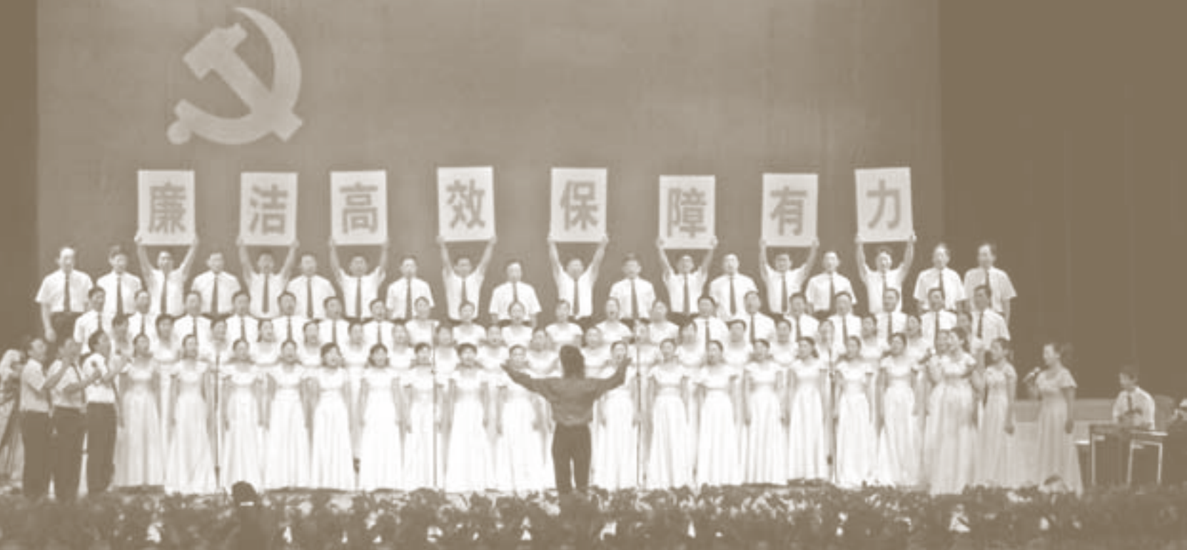
Sängerinnen und Sänger intonieren Revolutionslieder bei einem Chorwettbewerb der Stadtverwaltung von Yangzhou.