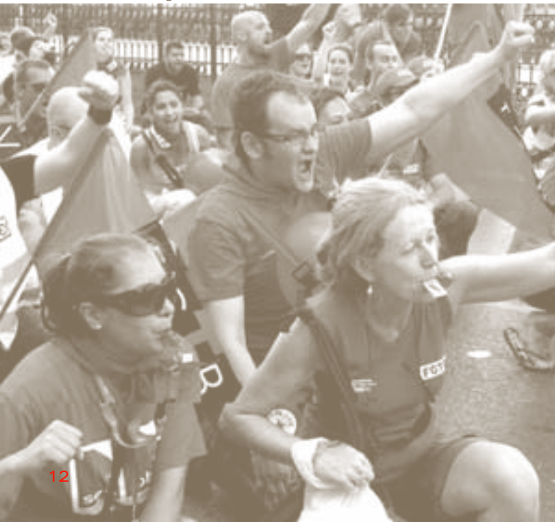
Belgische GewerkschafterInnen in Istanbul.