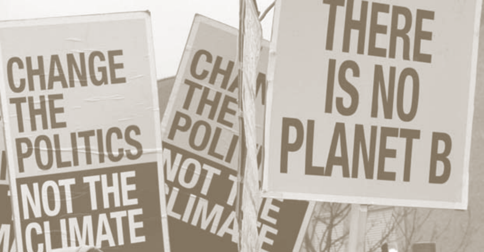
«Es gibt keinen Planeten B» – Protestschilder beim UN-Klimagipfel in Kopenhagen Ende 2009.